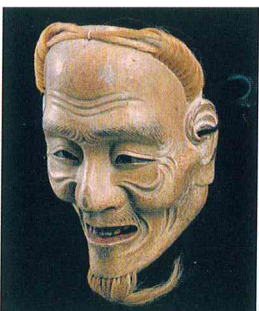
春日龍神の能面／前シテ 小尉