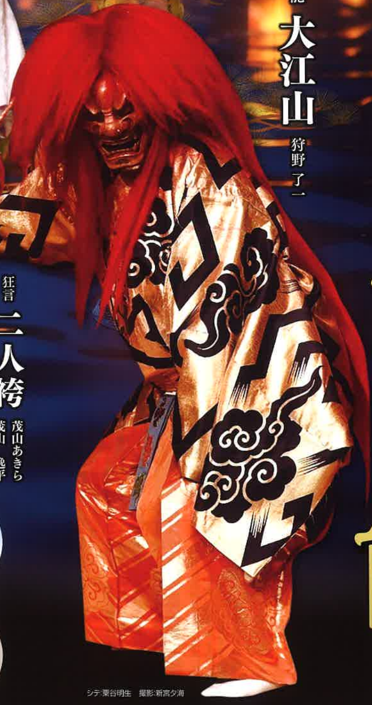
シテ:粟谷明生