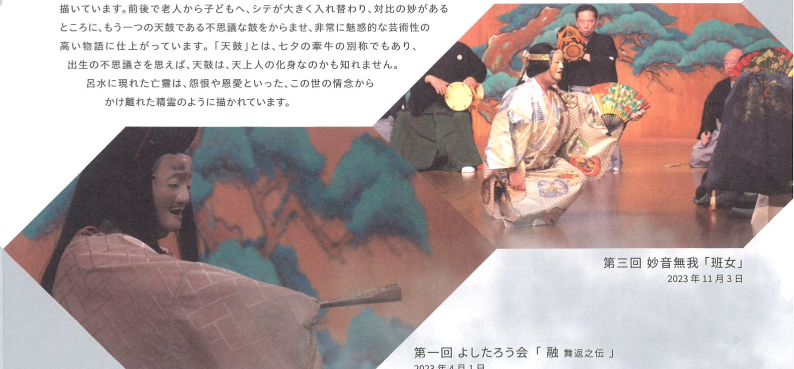
第三回 妙音無我「班女」 2023年11月3日

前半では、わが子である天鼓を失った王伯の、悲運の別れに対する情愛と嘆きを中心に描き、後半では一転して、天鼓という神秘的な存在の芸術に遊ぶ、自由闊達な精神を中心に描いています。前後で老人から子どもへ、シテが大きく入れ替わり、対比の妙があるところに、もう一つの天鼓である不思議な鼓をからませ、非常に魅惑的な芸術性の高い物語に仕上がっています。「天鼓」とは、七夕の牽牛の別称でもあり、出生の不思議さを思えば、天鼓は、天上人の化身なのかも知れません。呂水に現れた亡霊は、怨恨や恩愛といった、この世の情念からかけ離れた精霊のように描かれています。