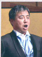
新開ゆうじ(しんかい・ゆうじ)

福岡市出身。1992年、国立音楽大学音楽学部声楽科卒業。音楽教員免許取得。在学中にザルツブルク・モーツァルテウム音楽院サマーアカデミー修了。2012年12月、第46回衆議院議員総選挙の比例九州ブロック単独36位で初当選をはたし、国会議員としての経歴をもつ異色の存在。