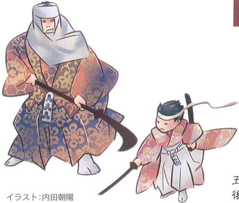
イラスト:内田朝陽